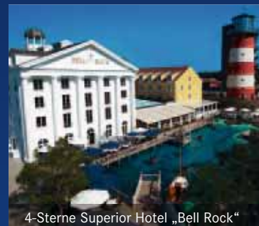
4-Sterne Superior Hotel „Bell Rock“